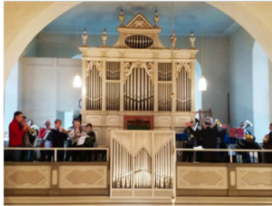
Posaunenchor Oldenstadt

Wir sagen allen, die sich im Posaunenchor eingebracht haben, ein herzliches Dankeschön für die gemeinsame Zeit, das Engagement und die vielen schönen musikalischen Momente.