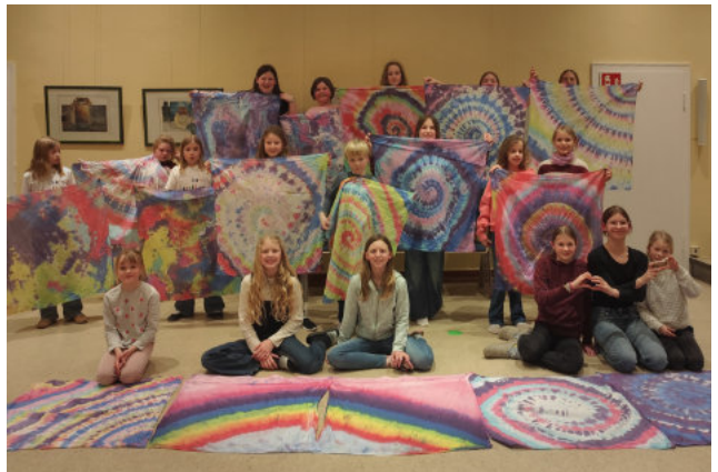
Kinderchor-Kinder übernachteten im Gemeindehaus.

Nachdem es den Kindern im vergangenen Jahr so gefallen hat, wünschte sich die Gruppe unserer älteren Kinderchor-Kinder auch in diesem Jahr ein Übernachtungswochenende. Am 14./15. März fand mit knapp 30 Kindern und jugendlichen Teamern ein fröhliches Chorwochenende statt. Wir haben mit den Proben für unser neues Kinderchor-Musical begonnen, das wir im September aufführen wollen. Diesmal ist es die Josefs-Geschichte aus dem Alten Testament, Näheres dazu in der nächsten „mit-tendrin“-Ausgabe.