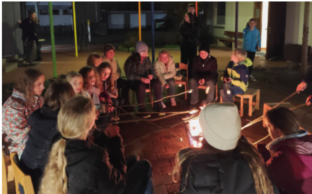
Am Abend gab es Würstchen am Lagerfeuer.

Am Sonntag nach dem Frühstück holten die Eltern ihre etwas müden, aber glücklichen