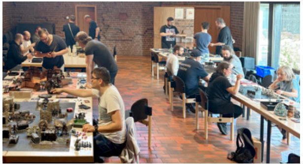
„EvJu meets Tabletop“ im Gemeindesaal St. Johannis

Tabletop-Spiele vereinen Modellbau und Strategiespiele in einem Hobby. Spieler bauen sich ihre Modelle zusammen, bemalen sie und treten anschließend mit ihren Modellen gegeneinander an. Dabei gibt es inzwischen eine gewaltige Vielfalt an Genres, die bedient werden, ob Star Wars, Marvel, Game of Thrones oder andere Fantasy-/Science Fiction-Settings – für jeden Geschmack ist etwas dabei. Der Name Tabletop kommt dabei auch nicht von ungefähr, denn die Größe der Spiele macht es erforderlich, für das Spielen 1 bis 2 Tische zu benutzen.