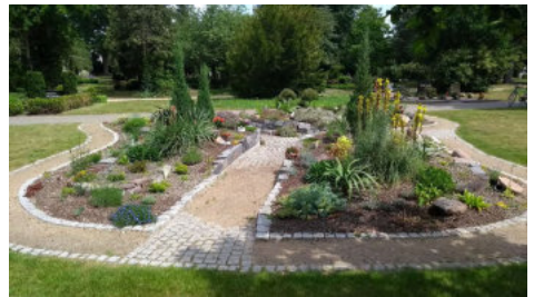
Grabanlage auf dem Hauptfriedhof

gen bis hin zu Baumbestattungen reichen. Dabei wird ebenso auf Natur und Umweltschutz auf dem Friedhof eingegangen wie auf Fragen rund um Formalitäten und Beisetzungskosten.