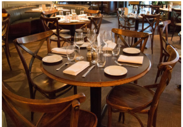
Ein Pubquiz muss nicht zwangsläufig in einer Kneipe stattfinden. Wie wär's mal in einem Gottesdienst?

Jesus selbst war ein Meister solcher Fragen. Er bringt Menschen ins Gespräch, lässt unterschiedliche Sichtweisen stehen und eröffnet neue Perspektiven. Statt fertiger Lösungen setzt er auf Hoffnung: dass Trauernde getröstet werden, dass Frieden wachsen kann und dass Gerechtigkeit kommen wird.